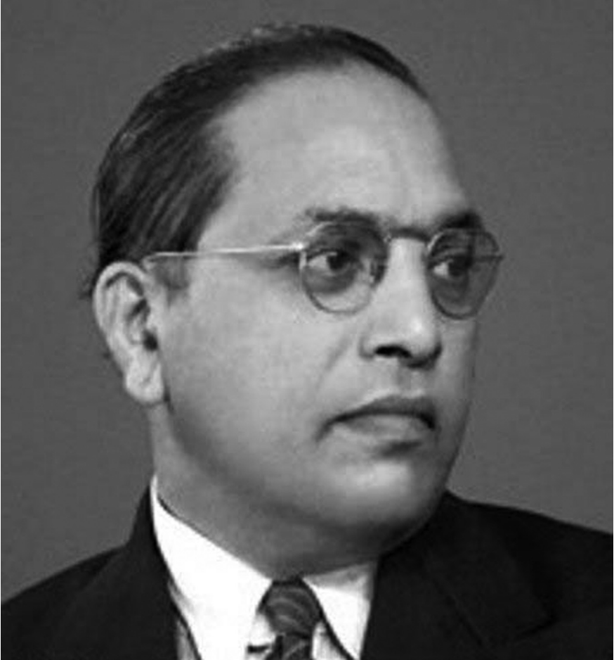
Babasaheb Dr. B.R. Ambedkar (14th April 1891 - 6th December 1956)